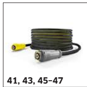
41, 43, 45-47