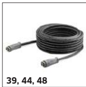
39, 44, 48